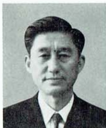
広島市教育長 齋 藤 岳 夫

国際平和文化都市広島にふさわしいこの行事を、心からお祝いいたしますとともに、広島少年合唱隊が今後ますます発展いたしますよう祈念してやみません。