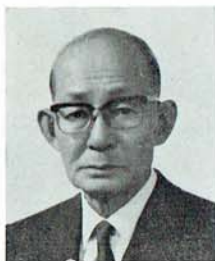
広島市長 山田節男