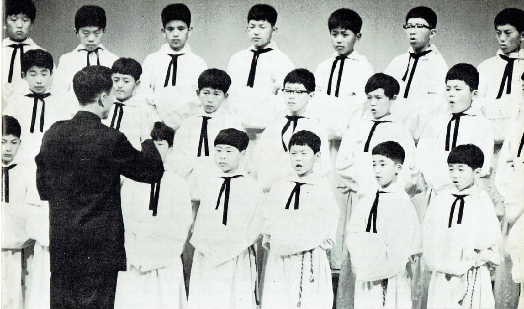
(第4回 招待演奏会スナップ)